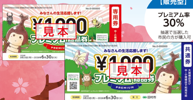
プレミアム商品券