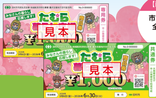
たむら暮らし応援商品券